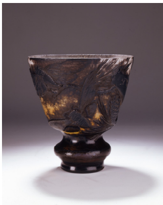
Émile Gallé, Les Pins de Ravenne , 1903.