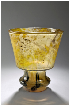
Émile Gallé, Coupe à décor d'épis de blé, vers 1903.

Le soleil du matin doucement chauffe et dore Les seigles et les blés tout humides encore, Et l'azur a gardé sa fraîcheur de la nuit. L'on sort sans autre but que de sortir ; on suit, Le long de la rivière aux vagues herbes jaunes, Un chemin de gazon que bordent de vieux aunes. L'air est vif. Par moments un oiseau vole avec Quelque fruit de la haie ou quelque paille au bec, Et son reflet dans l'eau survit à son passage. C'est tout. Mais le songeur aime ce paysage Dont la claire douceur a soudain caressé Son rêve de bonheur adorable, et bercé Le souvenir charmant de cette jeune fille, Blanche apparition qui chante et qui scintille, Dont rêve le poète et que l'homme chérit, Évoquant en ses vœux dont peut-être on sourit La Compagne qu'enfin il a trouvée, et l'âme Que son âme depuis toujours pleure et réclame.