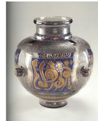
Émile Gallé, Vase Espoir , 1889.