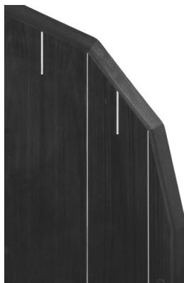
3 droit géométrique simple précieux