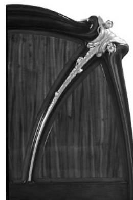
1 courbe végétal arrondi lisse ferronnerie