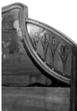
2 décoré marqueterie classique

Observe bien les chambres à coucher et retrouve le détail correspondant à chacune d'elles. Pour t'aider, lis les indications qui se trouvent sous les images.