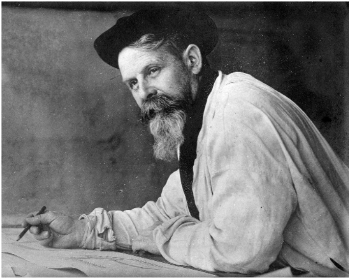
Portrait de Louis Majorelle

Louis Majorelle a grandi au milieu des objets d'art que réalisait son père Auguste. Impressionné par les formes et les décors de ces créations, il veut devenir peintre. Il suit des cours de dessin à Nancy puis à l'Ecole des Beaux-Arts de Paris.